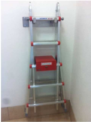
Beispiel einer möglichen Leitersicherung

Sind an eine Brandmeldezentrale nur automatische Brandmelder angeschaltet, so muss unmittelbar am FAT ein Druckknopfmelder angebracht werden.