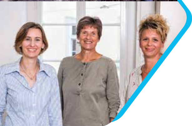
Fachstelle für pflegende Angehörige